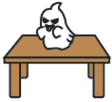
on the table つくえのうえ