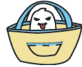
in the bag かばんのなか