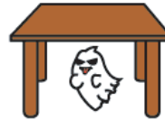
under the table テーブルのした