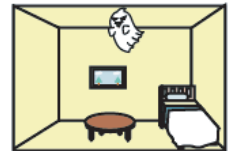
above the room へやのうえ